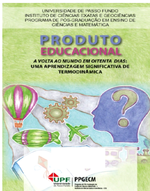
Figura 1: Capa do produto educacional