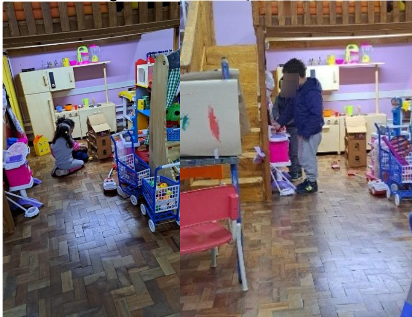
Imagens 17 e 18: Crianças brincando