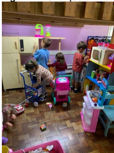
Imagem 24: Crianças brincando