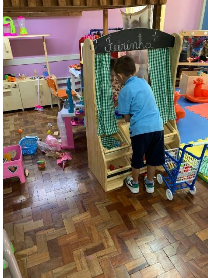
Imagem 22: Crianças brincando