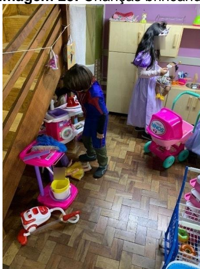
Imagem 23: Crianças brincando

que a caixa de ferramentas foi acionada para algum concerto, bem como menores as situações em que as crianças verbalizavam, por exemplo, ir até o espaço dos carros e simular sair para passear ou trabalhar. É possível compreender que o universo doméstico que gerou mais identificação e representação nas brincadeiras esteve atrelado às tarefas diárias e cotidianas que muitos deles experimentam no convívio familiar.