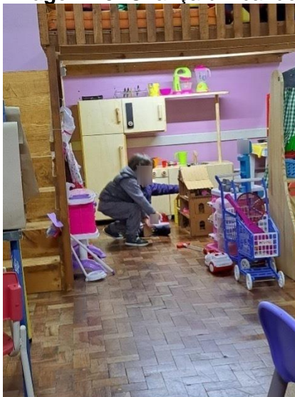
Imagem 19: Criança brincando