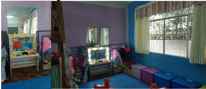
Imagens 13 e 14: Camarim e fantasias