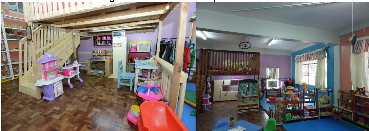
Imagens 15 e 16: Antes e depois da casinha

Foi um processo longo de busca por brinquedos de materiais duráveis e sem cores estereotipadas para meninos e meninas. Nas imagens 15 e 16 é possível ver como era anteriormente a casinha, abaixo do mezanino, e como ficou com o mobiliário em cor de madeira cru. A opção foi por uma cozinha modular, com pia, fogão, geladeira e armários acoplados. Também adquirimos uma feirinha, com bandejas e frutas em madeira e um camarim, para o setor de fantasias, além das comidas e outros apetrechos para a casinha.